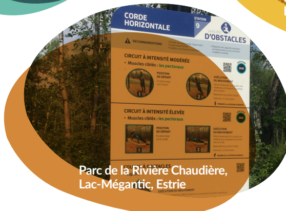
Parc de la Rivière Chaudière, Lac-Mégantic, Estrie