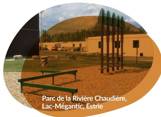
Parc de la Rivière Chaudière, Lac-Mégantic, Estrie