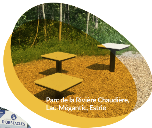
Parc de la Rivière Chaudière, Lac-Mégantic, Estrie