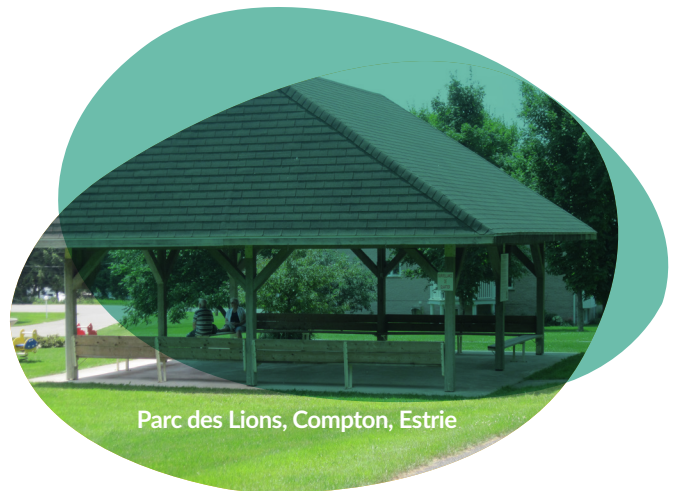
Parc des Lions, Compton, Estrie