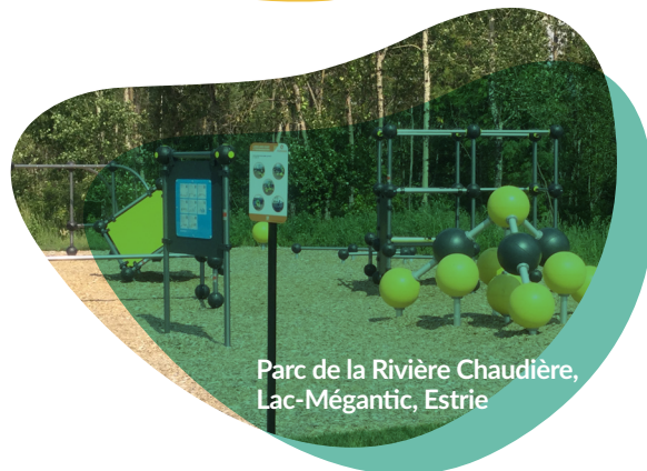
Parc de la Rivière Chaudière, Lac-Mégantic, Estrie